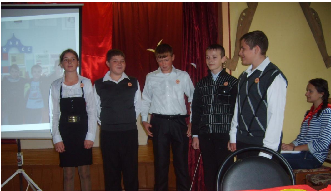
Семиклассники представляют свою школу на стартовой игре